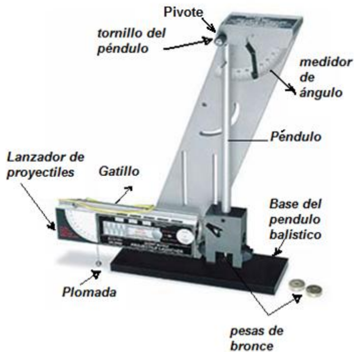
Figura 1. Péndulo balístico.